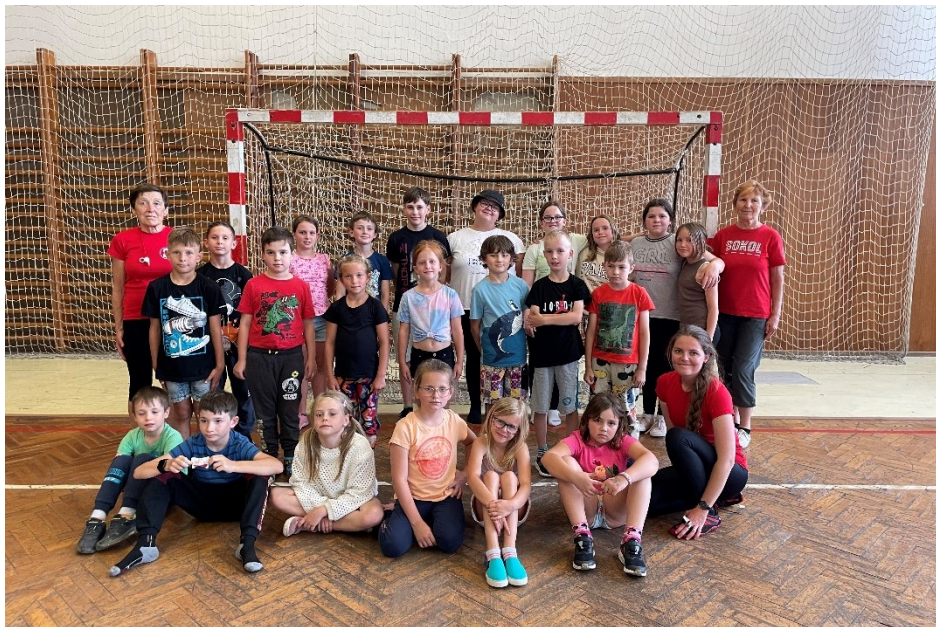
Mladší a starší žactvo