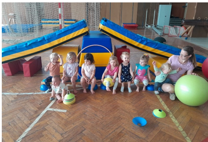
Cvičení pro rodiče a děti

Děkujeme všem malým a větším sokolíkům, kteří s námi od září s nadšením cvičili! V termínu od 17. do 22. července si užijeme náš druhý příměstský sokolský tábor. A v září se budeme těšit opět na značkách!