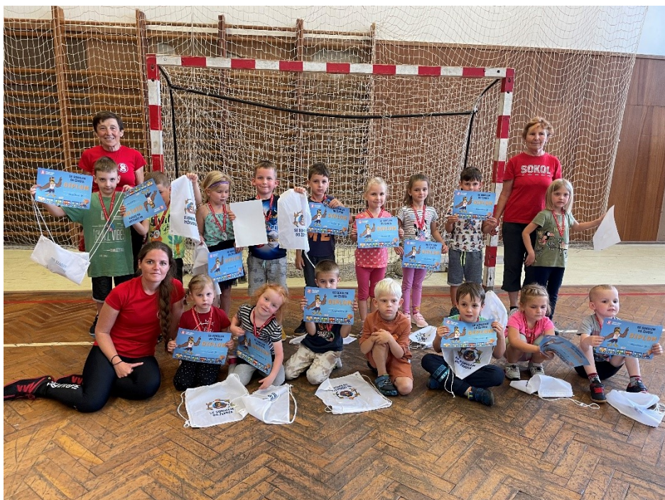
Nejmenší děti a předškoláci