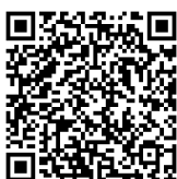
QR kód iOS