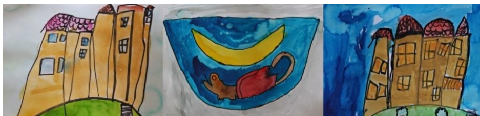
MŠ: 1. Anetka Svobodová, 2. Jenny Hůjová, 3. Emička Kalašová

Soutěž byla rozdělena do kategorií – MŠ, 1. stupeň ZŠ, 2. stupeň ZŠ a skupinové práce. Děkujeme všem dětem, které se soutěže zúčastnily. Věřím, že v další připravované výtvarné soutěži bude účast ještě větší. Pokud jste nestihli výstavu na tvrzi, poďte si prohlédnout vítězné obrázky.