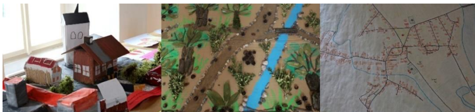
Skupinová práce: 1. 5. třída, 2. kolektiv dětí MŠ, 3. 9. třída

A samozřejmě velká gratulace malým výtvarníkům, kteří se umístili!